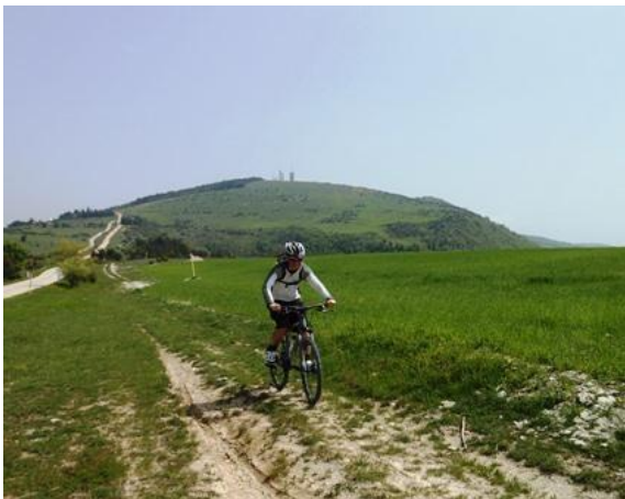
Salita al Monte Letegge; sullo sfondo il Monte D'Aria