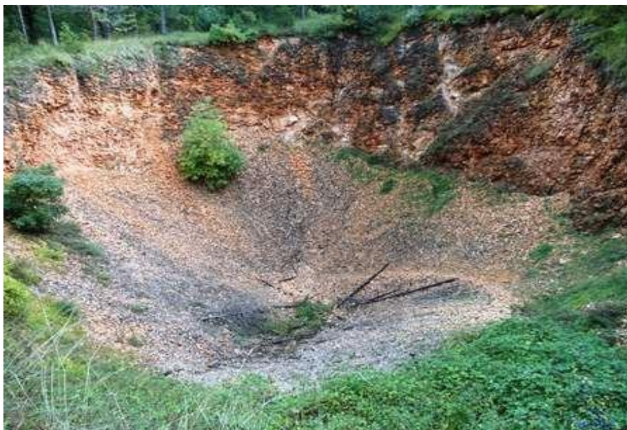
Il cratere della Buca del Terremoto ha un diametro di alcune decine di metri ed una profondità di circa trenta metri