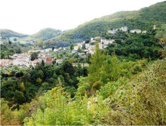
Serrapetrona in autunno