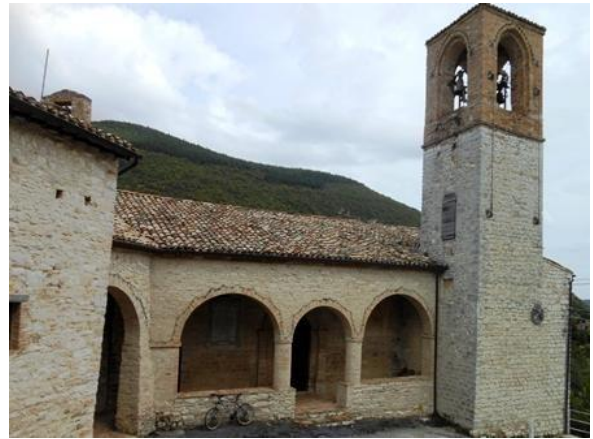
Chiesa di San Lorenzo a Castel San Venanzo