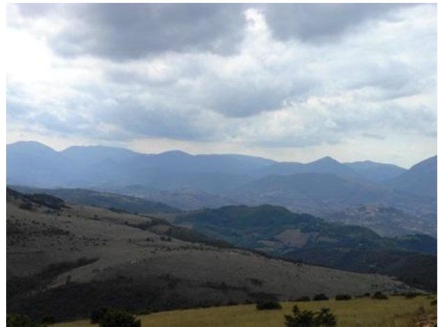
Panorama a 360° dal Monte Letegge